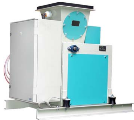
Doseuse pondérale gravitaire "JANOMATIC-é"