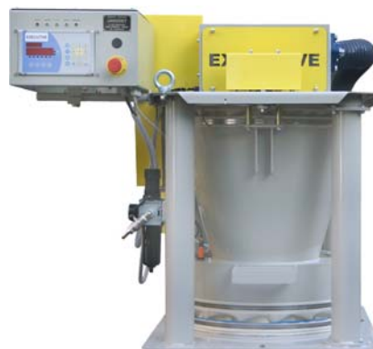
Balance de circuit EXECUTIVE 60+. Benne de pesage 60 litres, portée standard 50 kg, débit : 15 à 20 m³/h.